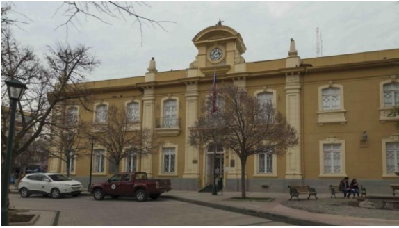
Edificio Gobernación Provincial Cachapoal