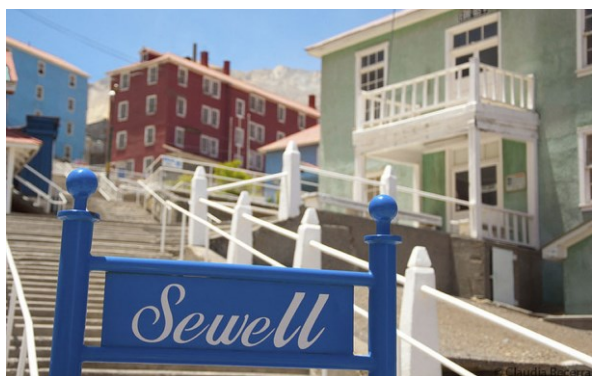
Campamento Minero Sewell

II.- Observa las siguientes imágenes que corresponden al patrimonio cultural de la región de O'Higgins y responde las preguntas.