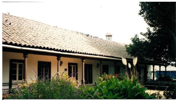
Casa de La cultura.

1.- ¿Conoces alguno de estos monumentos pertenecientes al patrimonio cultural? ¿Cuál?