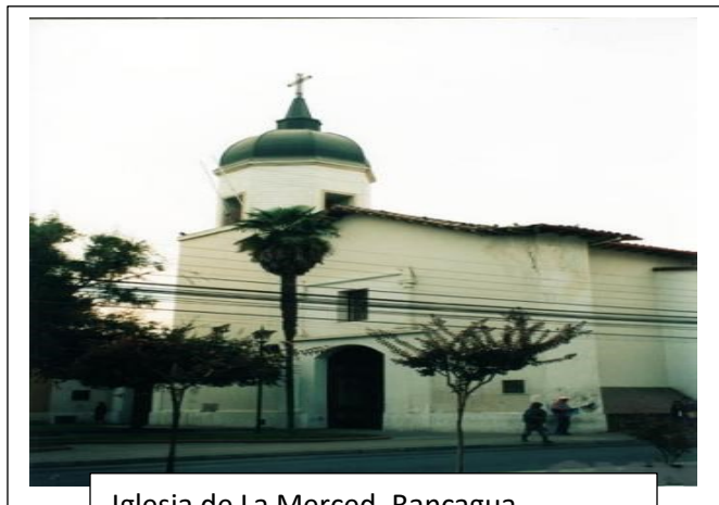
Iglesia de La Merced, Rancagua