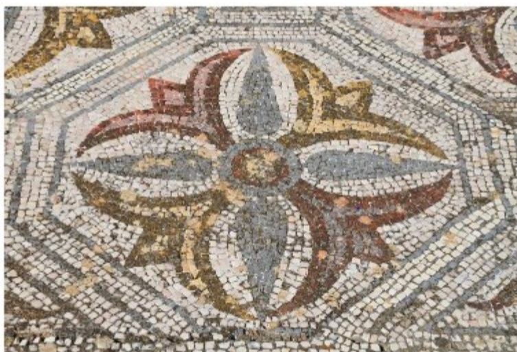
Villa romana de Pisões, Lusitania, Portugal

Los mosaicos han sido una forma de arte popular en varias culturas alrededor del mundo. Los primeros mosaicos conocidos fueron hallados en un templo mesopotámico que data del tercer milenio a.C. Compuestas de marfil, conchas y piedras, estas piezas decorativas y abstractas sentaron las bases de mosaicos realizados miles de años después en la antigua Grecia y el Imperio romano. Sin embargo, a diferencia de los fabricantes de mosaicos mesopotámicos, los artistas clásicos optaron por crear imágenes, patrones y motivos en sus mosaicos.