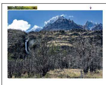
Incendio Parque Nacional Torres del Paine