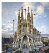
1) Sagrada Familia Cathedral Barcelona, Spain