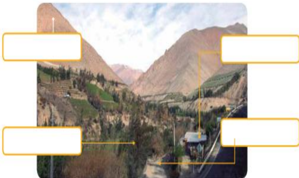
▲ Valle del Elqui, región de Coquimbo, Chile.