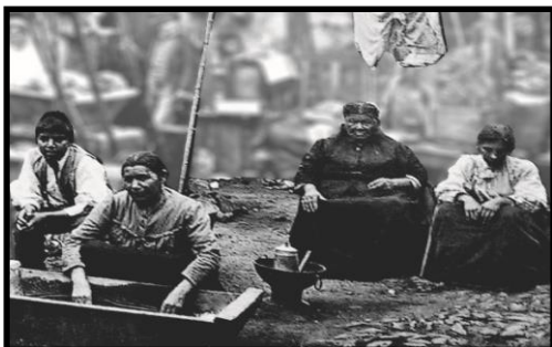
Niños trabajando en las industrias salitreras.

Observa las siguientes fotografías que marcan la cuestión social en Chile.