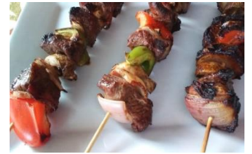
To eat Skewered meat