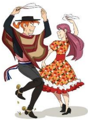
To dance Cueca

1) Look at the picture and read the vocabulary about our country. (Mira las imágenes y lee el vocabulario acerca de nuestro país)