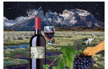
To drink wine