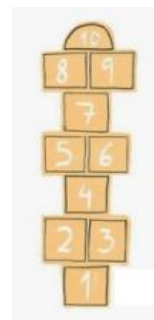
To play Hopscotch