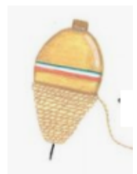
To play spinning top