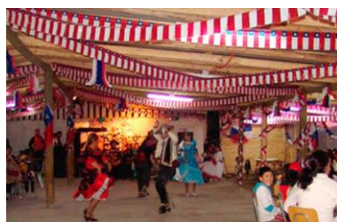
Go to fondas