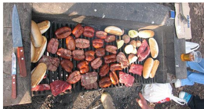
To have a Barbacue