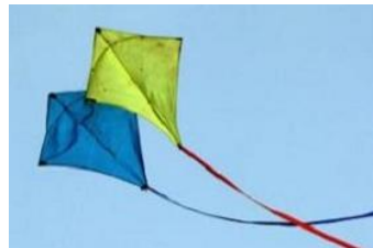
To fly kites