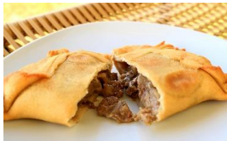
To eat meat pie or Empanada