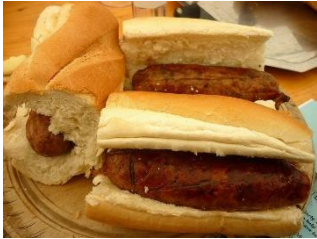
To eat Chorizo sausages sandwiches