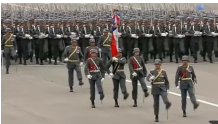
To see the military parade