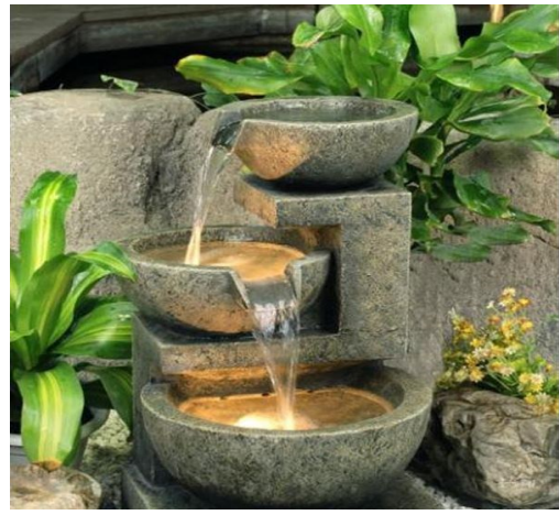
Ejemplos de fuentes de agua