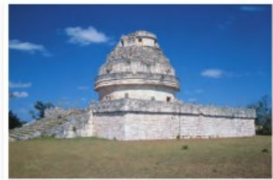
► El Caracol, observatorio astronómico de Chichén Itzá.

Este calendario fue complementado con la utilización de uno lunar o religioso de 260 días.