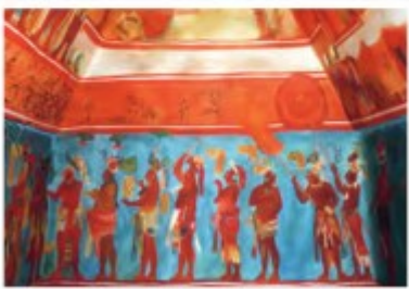
► Pinturas en un templo de la ciudad maya de Bonampak.

A través de ellas, representaron aspectos de su religiosidad y orden político, siendo recurrentes las escenas en que se mezclan figuras humanas, de animales y mitológicas.