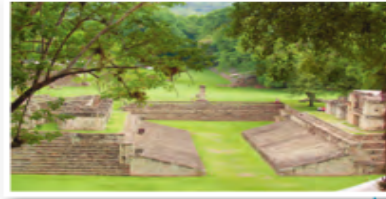
► Campo de juego de la pelota en ciudad maya de Copán.

La principal obra arquitectónica maya son los templos piramidales, construidos con piedra caliza que obtenían de canteras cercanas a las ciudades. Le agregaban una pasta de conchas molidas o piedras que servía de relleno o pegamento y, en algunos sitios, con ladrillos. Las edificaciones más importantes tenían funciones administrativas, religiosas, recreativas e incluso funerarias.