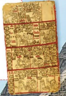
► Escritura en el Códice Tro-Cortesiano.

Era un complejo sistema en el que se representaban sílabas o palabras por medio de glifos (signos grabados, escritos o pintados). Estos se dibujaban en estelas (piedras altas talladas), códices (libros hechos en corteza de árbol) o vasijas de cerámica.