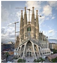
1) Sagrada Familia Cathedral Barcelona, Spain

1) Look at the pictures below. Can you recognize these famous places? Where are they? (Mira las imágenes ¿Puedes reconocer estos lugares famosos? ¿Dónde se encuentran?)