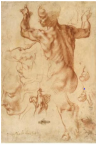
Dibujo: "Estudio para la sibila libia" (1512) Miguel Ángel Buonarroti