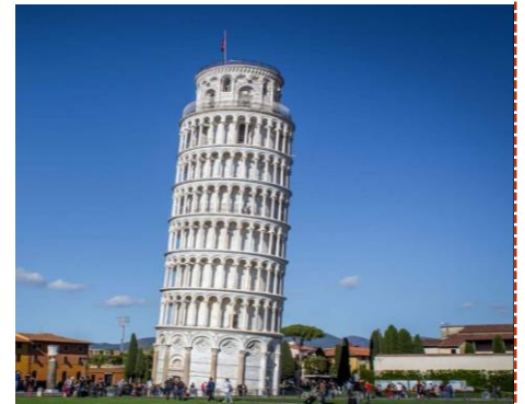
The leaning tower of Pisa

Where: London, England, and United Kingdom