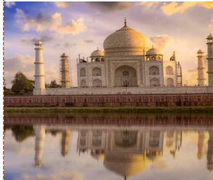
The Taj Mahal