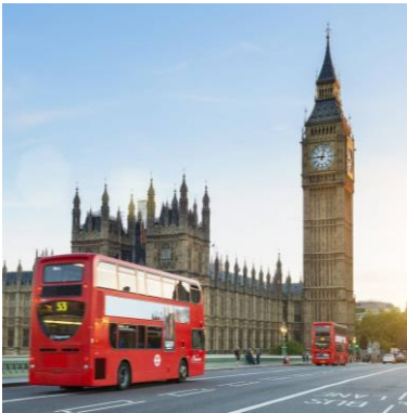
The Big Ben