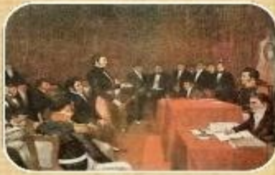
Junta de Gobierno de 1813