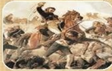
Batalla de Rancagua

Observa estas imágenes de la Patria Vieja.