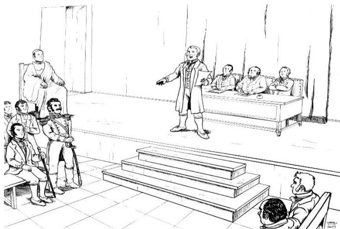
Primer Congreso Nacional.