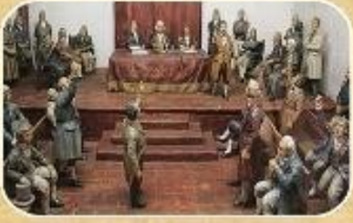
Primera Junta de Gobierno