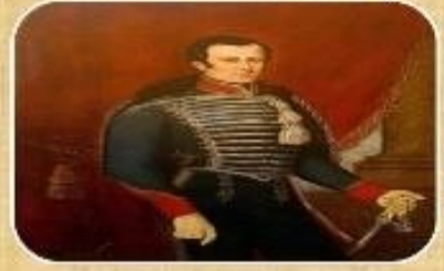
Gobierno de José Miguel Carrera