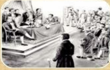
Primer Congreso Nacional