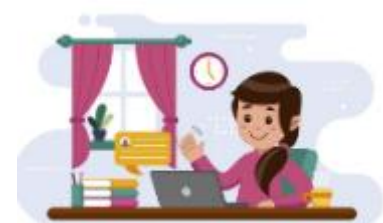
Work on the computer

1) After seeing the images of home routines, Can you tell me where you can do those activities? (Después de haber visto las imágenes de las rutinas del hogar, puedes decirme en qué lugar de la casa puedes hacer esas actividades. Sigue el ejemplo)