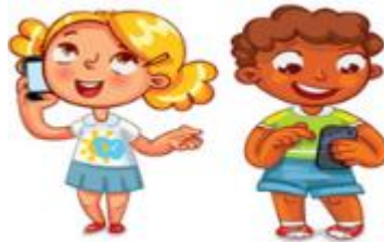
Chat with friends