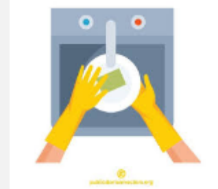
Do the dishes