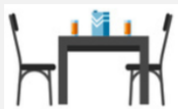
Chair and table