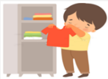
Clean up my room