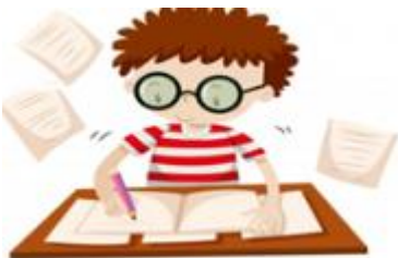
Do my homework