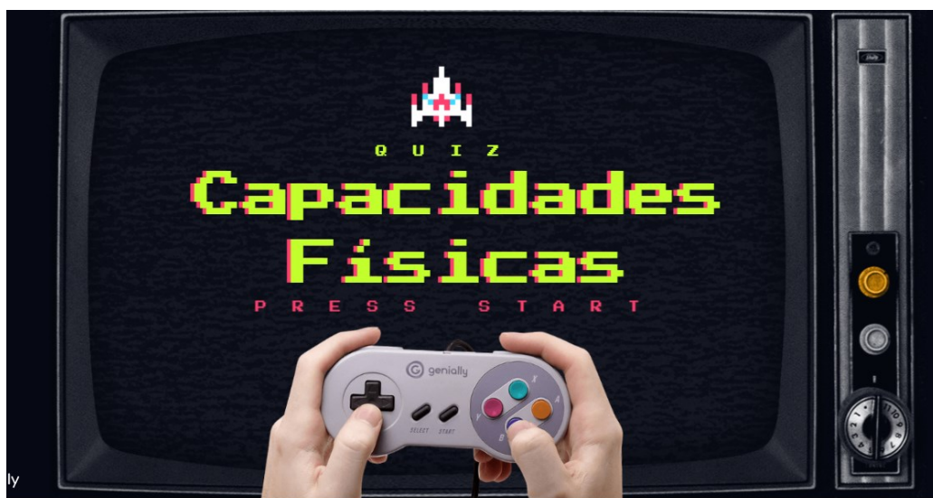
Imagen de la portada del juego virtual creado con el fin de mejorar el aprendizaje de los estudiantes de forma divertida.