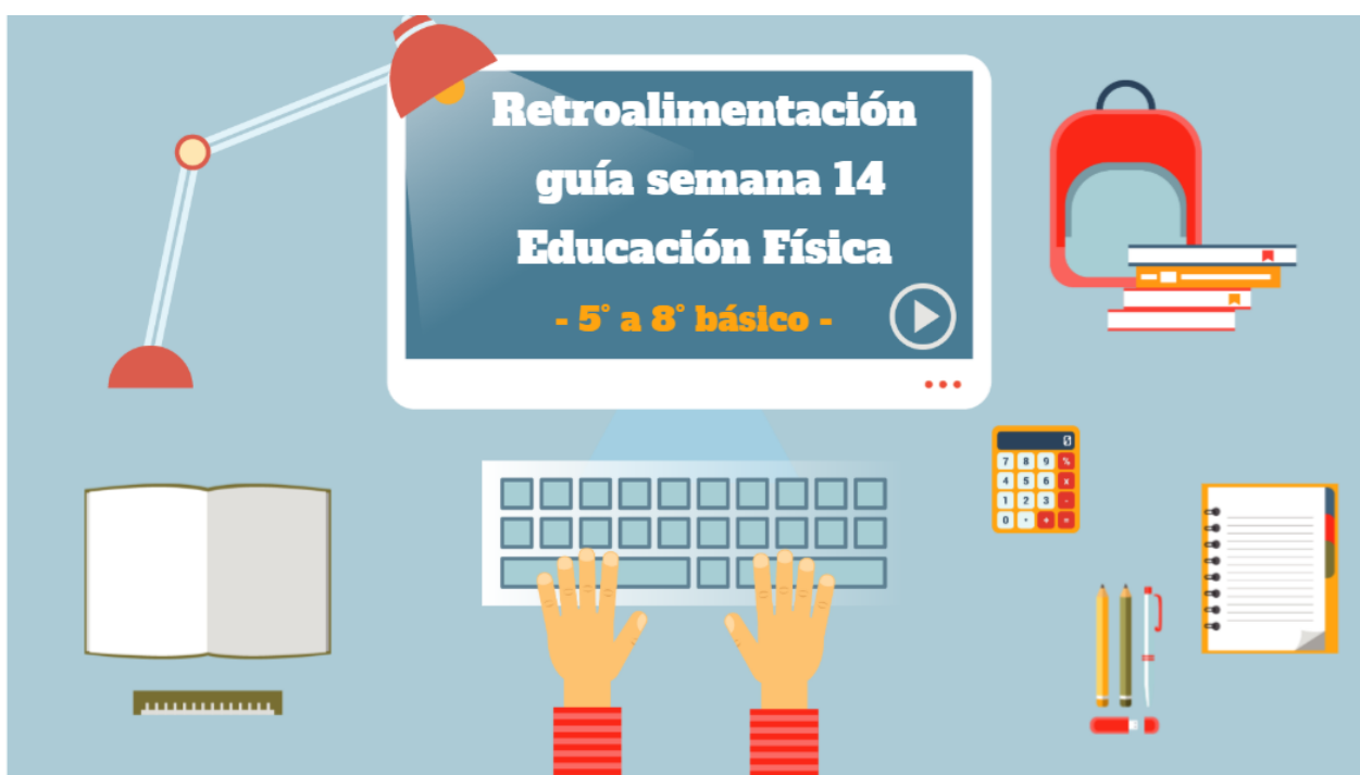
Imagen de la portada de la presentación power point con audio, que explica la forma de hacer la guía de la semana 14.