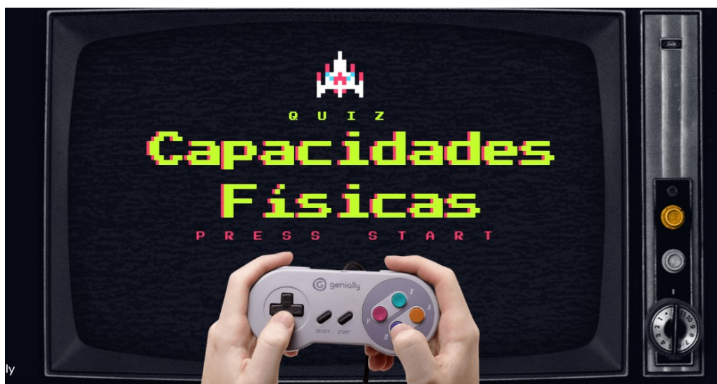
Imagen de la portada del juego virtual creado con el fin de mejorar el aprendizaje de los estudiantes de forma divertida.