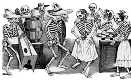
José Guadalupe Posada

2. Explica o señala si Conoces alguna técnica del grabado, Te imaginas como sería el paso para la construcción de una imagen de este tipo. Describe.