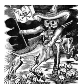
José Guadalupe Posada