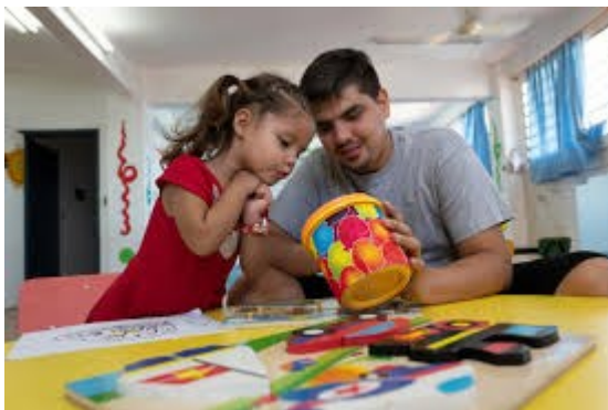
Trabajando en casa Padre e hija