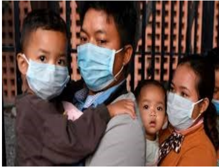
Uso de mascarillas