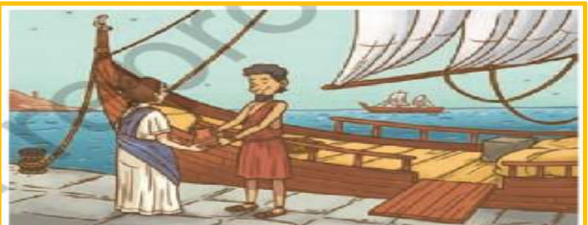
« Comerciante griego intercambiando aceite de oliva en un puerto.