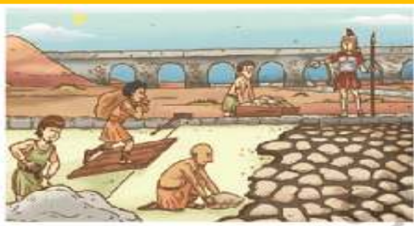
« Romanos construyendo caminos.

¿Qué observas en las imágenes? ¿Qué oficios observas? ¿Aun excite algún oficio que se refleje en las imágenes? ¿su vestimenta se parece a la de la actualidad? ¿Aun utilizamos el barco como medio de transporte?