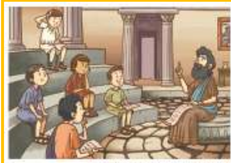
« Niños griegos en el colegio.

Observo, leo, pienso y respondo en voz alta