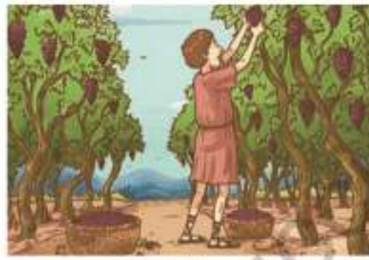
« Agricultor romano trabajando.

¿Qué observas en las imágenes? ¿Qué oficios observas? ¿Aun excite algún oficio que se refleje en las imágenes? ¿su vestimenta se parece a la de la actualidad? ¿Aun utilizamos el barco como medio de transporte?