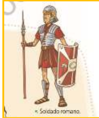
« Soldado romano.