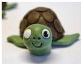
Tortuga de plastilina para hacer c... pinterest.com