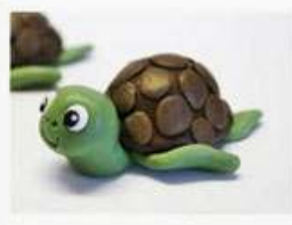
¿Cómo hacer comida de arcilla? es.kagouletheband.com