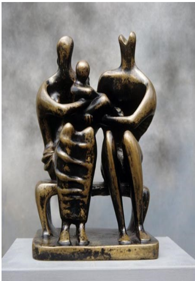
Henry Moore, grupo familiar