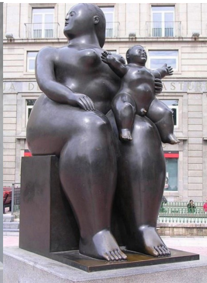
Fernando Botero, Maternidad