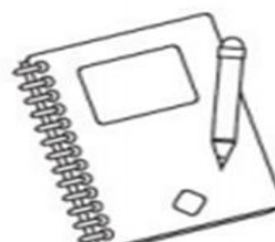
Cuaderno de papel reciclado