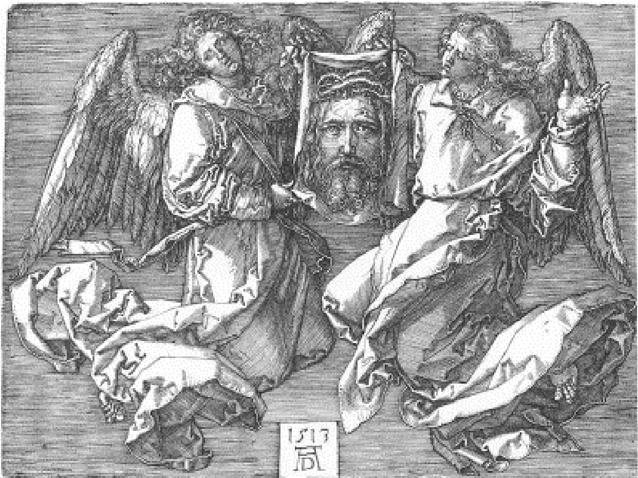
Albrecht Dürer, Veronica, 1513.