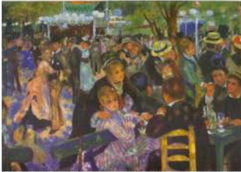
Auguste Renoir: "Moulin de la Galette."

Observa las imágenes que a continuación se presentan e investiga la biografía de los autores y la descripción de las obras creadas. Escribe en tu cuaderno la biografía investigada y descripción de la obra.