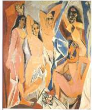
"Les Femmes d'Alger (O. J.)" Pablo Picasso