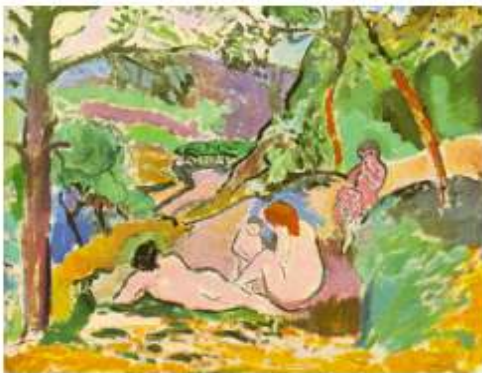
Henri Matisse: "Pastoral".