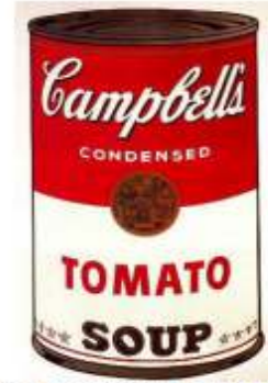
"Sopa Campbell". Andy Warhol