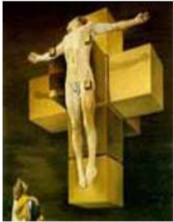
"Corpus Hiperbárico" Salvador Dalí