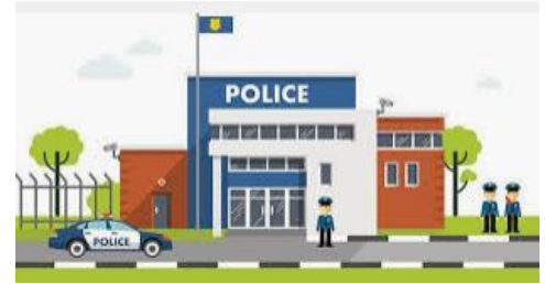
POLICE STATION (estación de policías)