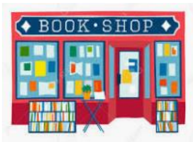
BOOK SHOP (librería)