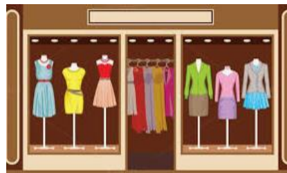
Clothes shop (tienda de ropa)