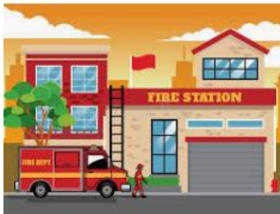
FIRE STATION (estación de bomberos)