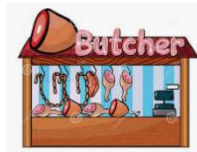
BUTCHER SHOP (carnicería)