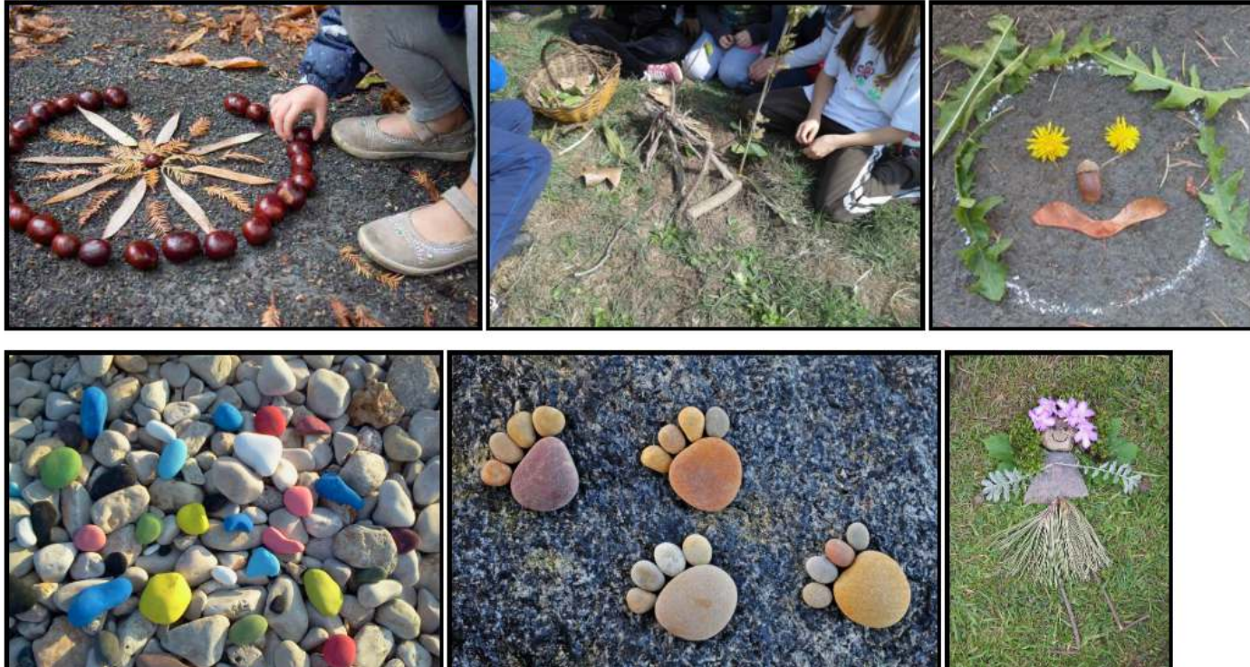
Ejemplos de trabajos que los estudiantes podrían llegar hacer del estilo Land Art