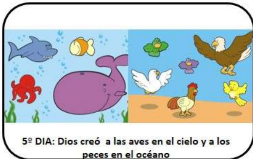
5º DIA: Dios creó a las aves en el cielo y a los peces en el océano