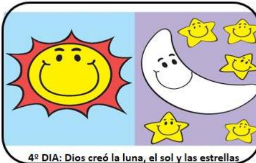
4º DIA: Dios creó la luna, el sol y las estrellas