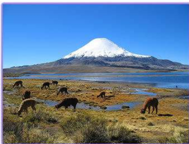
Parque nacional Lauca