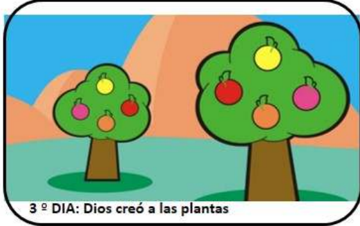
3º DIA: Dios creó a las plantas