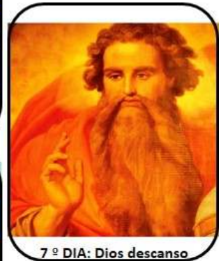
7º DIA: Dios descanso