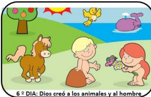
6º DIA: Dios creó a los animales y al hombre