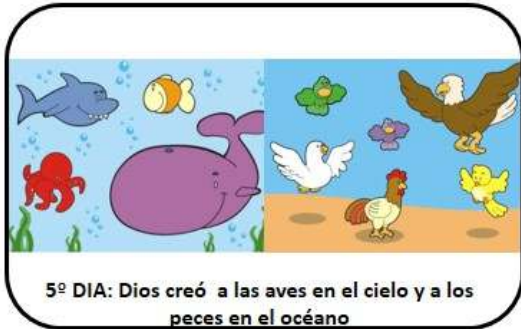
5º DIA: Dios creó a las aves en el cielo y a los peces en el océano