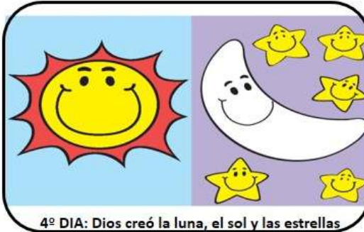
4º DIA: Dios creó la luna, el sol y las estrellas