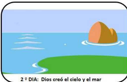
2º DIA: Dios creó el cielo y el mar