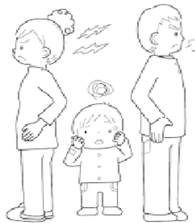
Familia de padres separados