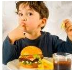
Comer hamburguesas y bebidas