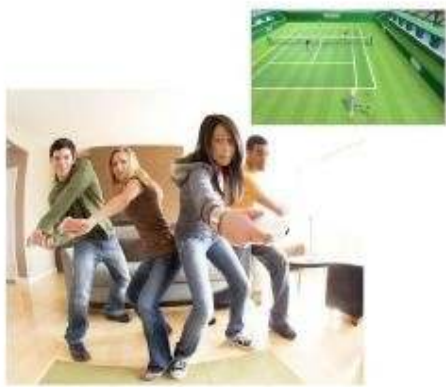
Hacer deportes con la Wii