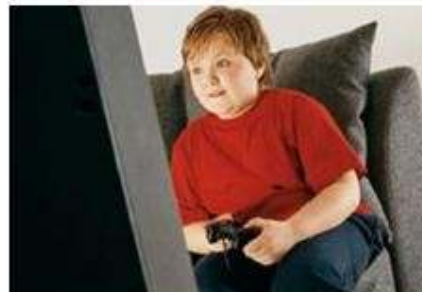
Jugar horas en la computadora