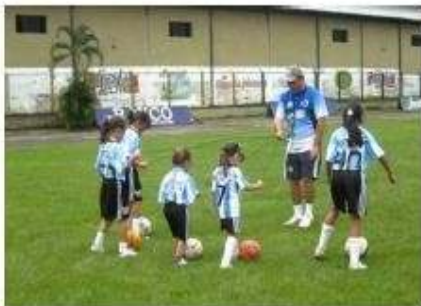
Practicar deportes al aire libre