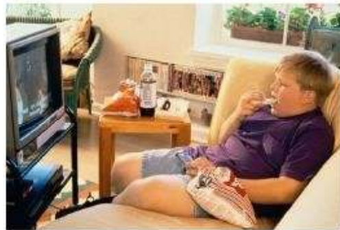
Sentado frente a la tele mucho rato